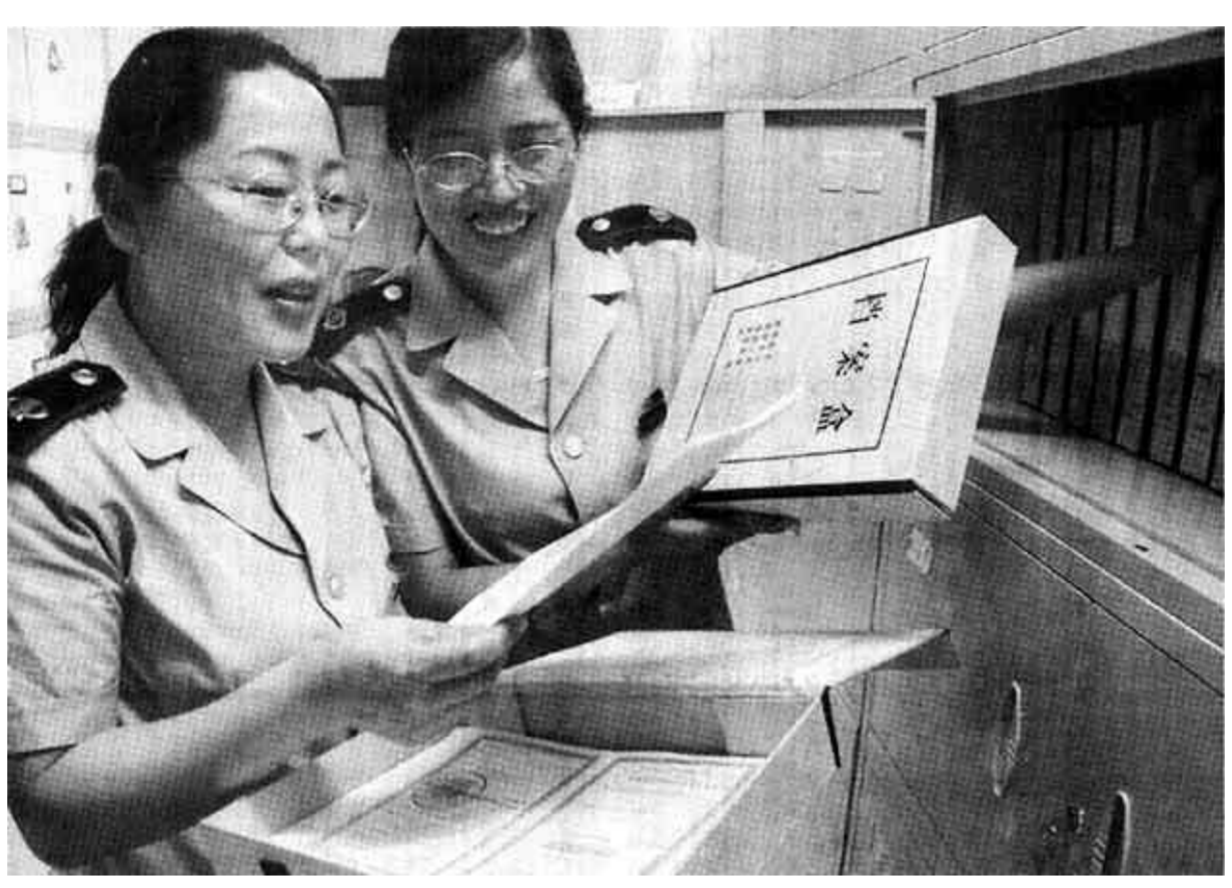
市地税局石化分局狠抓税收工作制度化建设，他们将辖区1600多户纳税企业全部纳入档案管理，为实施征收、检查、稽查工作打下了基础，从而保证了税收工作的开展。

本报讯 近日，市公交公司向各车队的535名公交车司机的亲属发出一份信，要求他（她）们当好家庭安全员，与单位共同携手，筑起安全生产的牢固防线。这是该公司为深化正在开展的安全生产月活动中所采取的一项新举措。 针对公司以往驾驶员违章高、事故隐患多的实际，公交公司抓住开展安全生产月活动的时机，积极探索实行无缝隙安全管理新机制。首先，组织了由安全科、稽查科、各车队安全员20余人组成的联合检查组，制定了详细的检查计划，采取跟车上路、蹲点守候、测量车速、正班正点率考核等多种措施，有效地遏制了驾驶员违章、违纪现象。其次，强化安全力量，公司安全科由原来的3人增至7人，9个车队都配备了一名专职安全员，为驾驶员安全行车奠定了基础。同时把安全管理由单位向家庭延伸，要求每一位驾驶员的亲属积极配合单位，当好家庭安全员，既要理解和关心驾驶员的工作，又要充分利用一切机会，多嘱咐、多叮咛，让驾驶员时刻绷紧安全这根弦。公司还通过定期或不定期召开家属汇报会和经常走访等形式，了解驾驶员的思想状况和家庭情况，及时协调和帮助解决一些家庭遇到的实际困难和矛盾，努力为驾驶员创造良好的工作环境和生活环境。一系列行之有效的措施，使公交公司安全生产工作迅速扭转了被动的局面，截至目前，驾驶员违章、违纪率已由原来的13%左右下降到5%以内。 （徐纯亮 孙云利）