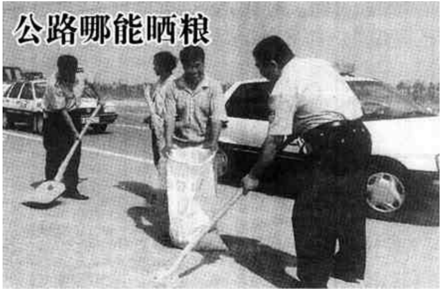
6月16日至23日，市交警直属二大队为做好麦收期间的交通安全工作，组织宣传车深入辖区乡镇、村庄开展了宣传活动。图为交警们正帮公路上晒粮的农民收麦子。

夏天到了，王女士提醒消费者在购买消暑食品时，最好到固定的摊点购买，尽量少买流动小商小贩的东西，缺斤短两不说，还惹一肚子气。 (李丽娜 田力)